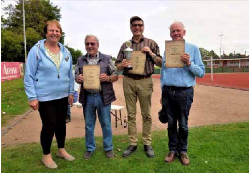
So lächeln Sieger!! (Vereinsmeisterschaft 2021)