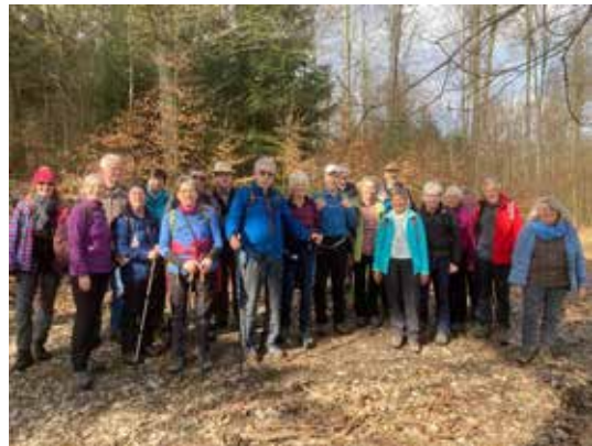
die Gruppe Sportwanderung