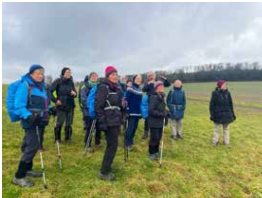
die Gruppe Berg- und Tal

Informationen aus dem Kneipp–Verein Wunstorf e.V. für den Zeitraum 01.05.2024 bis 31.08.2024