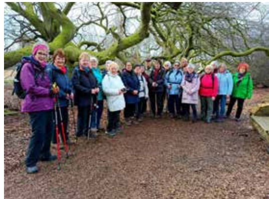
die Gruppe Kurzwanderer