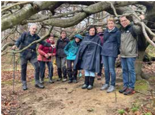
die Gruppe Wald- und Wiese